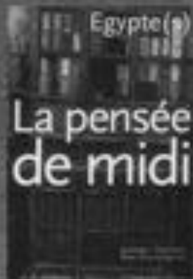
Egypte(s) La Pensée de midi N°12 (printemps 2004) Touche bleue/rouge édité par Actes Sud

Thierry Falme Rédacteur en chef de La Pensée de midi